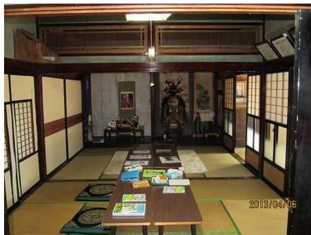
仏間、地獄絵図と鏡

なんの予備知識もないまま、ビデオ鑑賞しました。このアニメは、地元上市、滑川の小学校を舞台とし