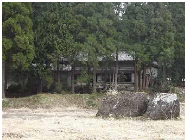
水田跡地から古民家を見る

て描かれており、監督さんも上市出身の方とか、最初拝見した時は、何なんだろうかと疑問に包まれておりましたが、画面が進むにつれて少しずつ判ってきて、舞台となった滑川の田中小学校の階段は本造りの懐かしい香りのもが描かれており、続いて、上市浅生の民家では、畑の端にある石がそこにあった。民家での間取りも同じで、雨と雪が駆け回っている様子が浮かんでくる。