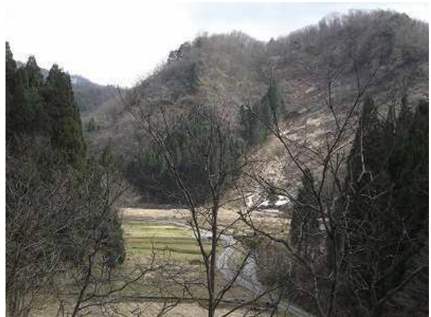
当該集落、水田風景、

ここで、我らは、皆さんがかくも感動したその背景として主に古民家について多少専門的に理屈をつけてみることにする。