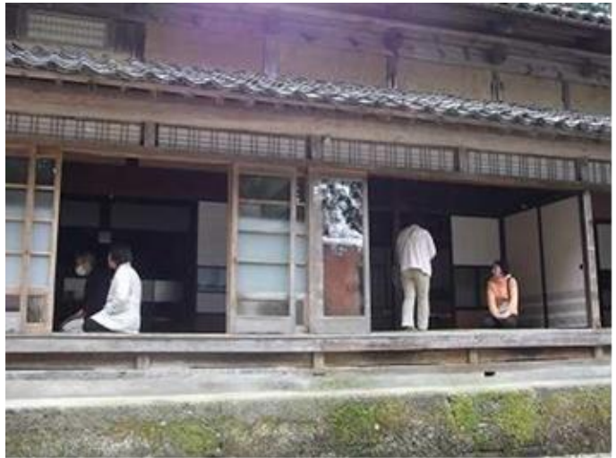
古民家の縁側でのくつろぎ

(1.4) コミュニケーション； 現代建築は(家)の中と外をしっかりと分離しているので、ご近所さんとのコミュニケーションには努力して実現させるものといった感がある。これに対して古民家には縁側があり、(家)の中と外が連続していて、どこまでも見通せる。この見通しは、家のみならず外でも集落でも一緒である。家の中の生活の匂いが外にまで流れている。そんな雰囲気のもので、コミュニケーションはごく自然に図られている。