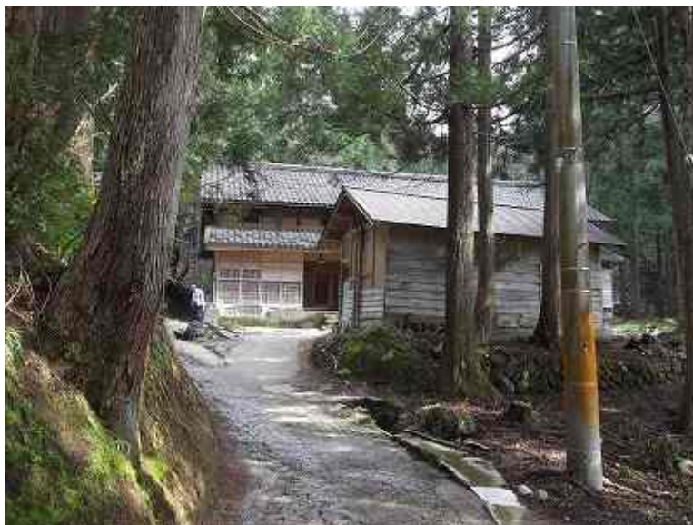
アニメの舞台となった古民家と周辺風景

そこで、直ちに古民家と木造校舎を視察し、我ら住人あるいは教師の方々と語り合い、古民家と木造校舎について少し理屈っぽくまとめてみた。ご覧ください。