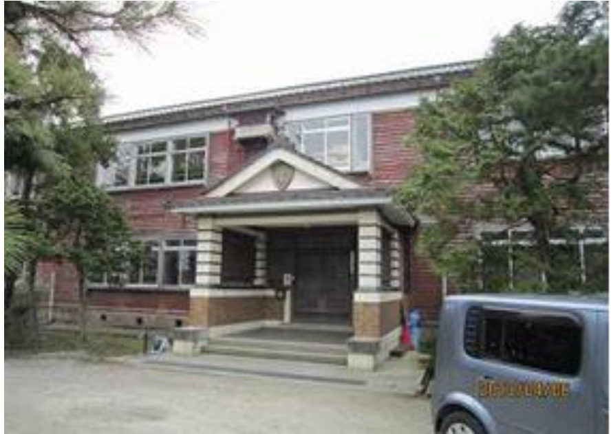
田中小学校校舎正面

おりしも、昨年より災害時の避難施設として、ふさわしくない、という理由で全面解体し、鉄筋コンクリート造に建替えるとの話が突然持ち上がる。反対する組織も無く、人も居ない状況で話が進み、建替えの基本計画も無く、実施設計に入る状態であった。