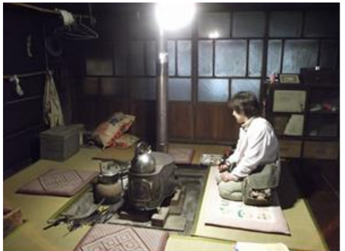
古民家の居間と薪ストーブ

(2.1) 何でもそろっていると考えなくなる； 何も無い広場で子どもが集まると、どうやって遊ぶ