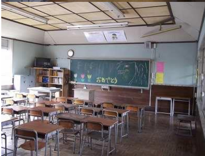
田中小学校2階、廊下と教室