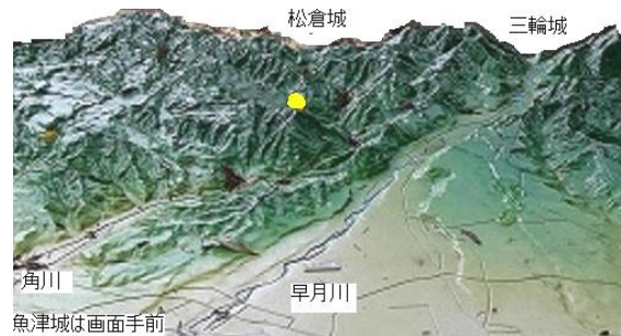
図1 松倉城とその周辺 1)

南北朝の頃には魚津の南奥の山に松倉城が築かれ、近くに松倉金銀鉱山もあって、室町の頃には麓の鹿熊が城下町として大いに栄えていた。しかし、城主椎名氏が上杉勢に攻められて敗走してからは、城下町機能が少しずつ今の魚津に移され、前田氏の支配下になってからは完全に魚津へ遷町となった。(3章にも記