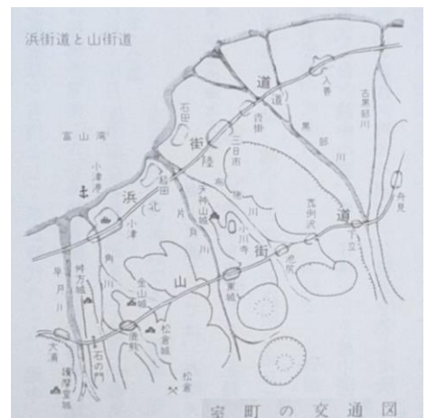
図2 室町時代の交通図 2)

中世では多少内陸に入ったルートと山ルート二種があった。(後出するが)魚津山麓部に位置する松倉(鹿熊)が当時、東部域の政治経済の中心地であったためである。山ルート(図2)は西から東の順に、…大浦、鹿熊、東城、池尻、嘉例沢、下立、舟見、…である。なお、近世に入って街道は沿岸ルートとなった。