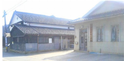
写真2 米騒動、現存の米蔵

(2)発祥地論議：米騒動については、そもそもの発祥は東水橋であり、その後には滑川や魚津にも勃発。魚津では騒動の参加者が多く、かつ新川随一の町であったことに加えて、当時の米蔵(写真2)が現存していたこともあり、発祥の地は魚津とされている。