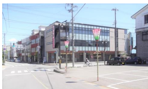
写真4 本陣と奉行所の跡 本陣跡に建つ建物。奉行所は手前駐車場。