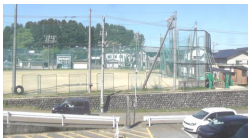
写真3 御旅屋跡 御旅屋跡地はかつて小学校敷地、今は共有グランド。本陣とは斜め対面

本陣と脇本陣は町の中心である中町にあった。本陣は奉行所の対面に位置していた。宴会場ばんば会館(3階建て建物)の場所がかつて本陣である。そこには本陣跡といった看板はない。なお、脇本陣については、本陣前交差点から東方向数十 m のところにあったという。