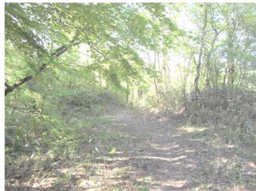
写真2 倶利伽羅峠の山道