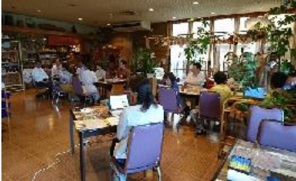
Hor 氏、 体は腸からとのこと、 血液などの健康の話