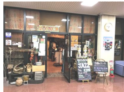
会場のお店の正面

朝活の会場としては、ある程度ゆっくりできて駐車場があり便利な所としております。上市では上記要件にぴったりの会場がM's cloudさんのお店です。またお店のマスターが朝活に理解をいただいておりますので朝活はいやがうえにも毎回盛り上がってます。