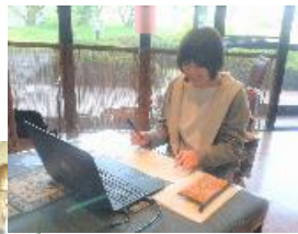
Nis 氏、 人生を語る、 絵文字で 人を元気に