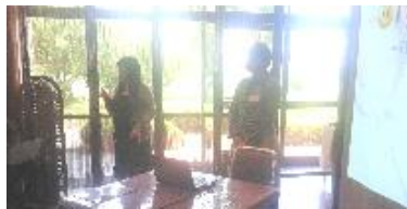
エクササイズ、花の家に(アミおおかみこどもの雨と雪の舞台)