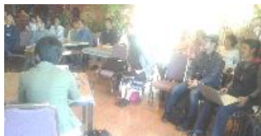
Hor 氏、ジャニーズの大ファン。ジャニヲタ！の様相