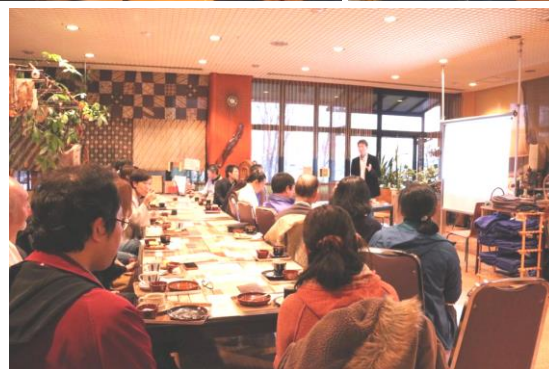
永吉さん進行役の朝活風景